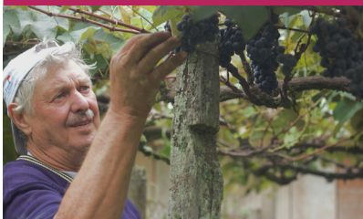
ITÁLICOS – COLHEITA DE UVA PARA FEITIO DE VINHO, PARREIRAL DE BEPPE BASSO