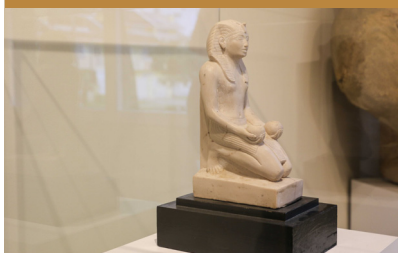
AKHET: O HORIZONTE DOS DEUSES