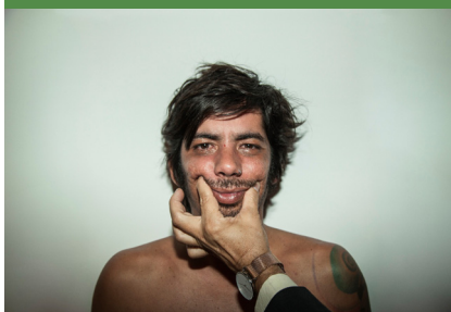
BRASIS NO PAIOL APRESENTA CHINA